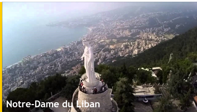
Notre-Dame du Liban