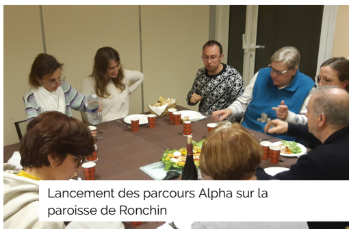
Lancement des parcours Alpha sur la paroisse de Ronchin