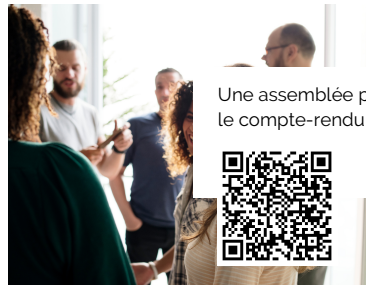
Une assemblée paroissiale s'est tenue le 17 février, le compte-rendu est disponible sur le site internet